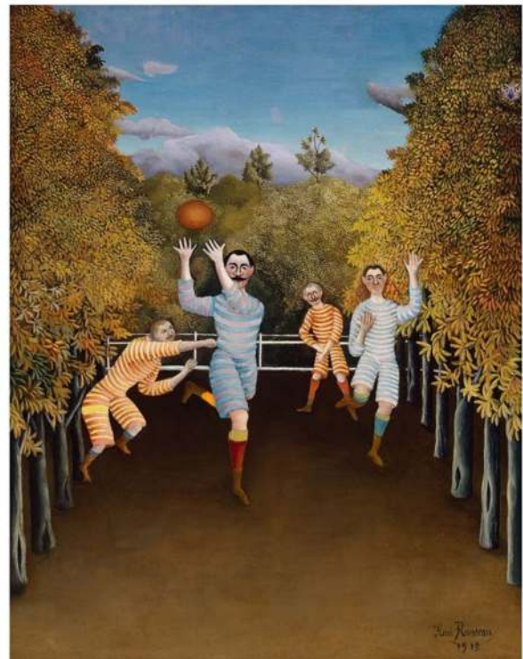
“Les joueurs de football” de Henri Rousseau dit Le Douanier Rousseau - tableau de 1908 (gauche)