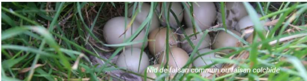
Nid de faisán commun ou faisán colchide