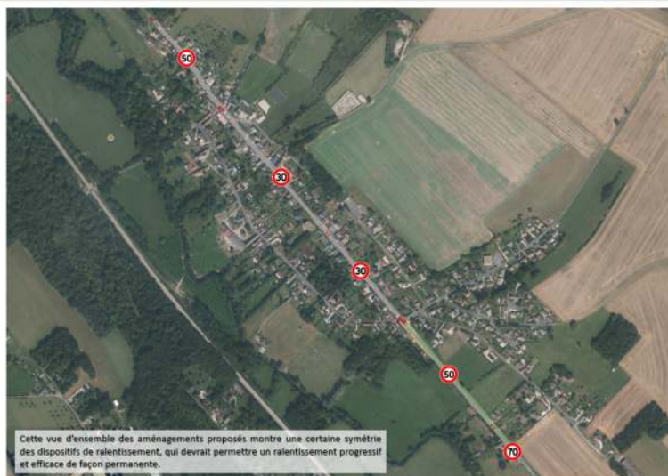
Vue d'ensemble des aménagements proposés

Cette vue d'ensemble des aménagements proposés montre une certaine symétrie des dispositifs de ralentissement, qui devrait permettre un ralentissement progressif et efficace de façon permanente.