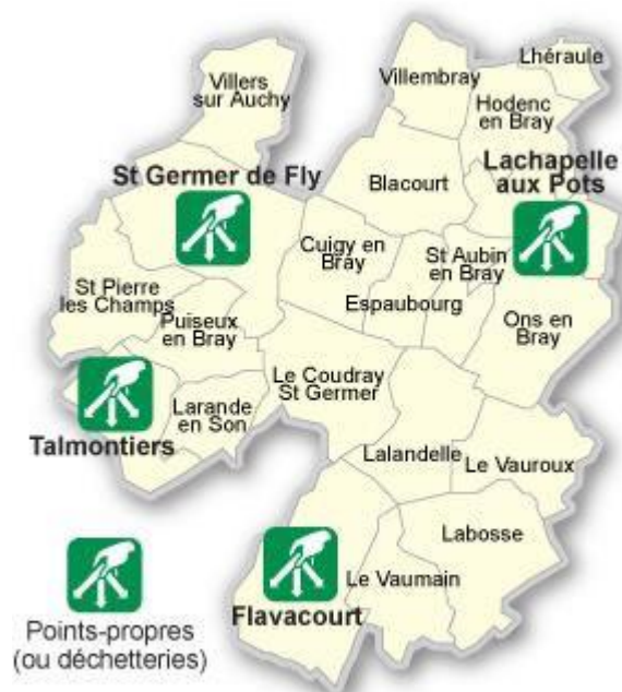
Carte des déchetteries

Le samedi 9h30-12h00 et 14h00-17h00 Pour avoir accès aux mini-déchetteries intercommunales du Pays de Bray, quelques règles élémentaires sont à suivre par chaque usager.